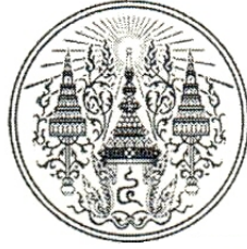
รูปที่ ๑ ดุมตราพระมหามงกุฏ