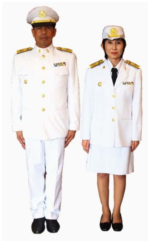
รูปที่ ๔ เครื่องแบบปกติขาวของพนักงานสถำบ้น