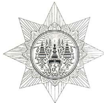
รูปที่ ๖ เข็มวิทย์ฐานะ